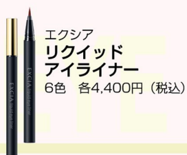
EXCIA リキッド アイライナー 6色 各4,400円(税込)