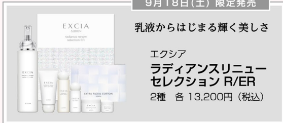
EXCIA ラディアンスリニュー セレクション R/ER 2種 各13,200円(税込)