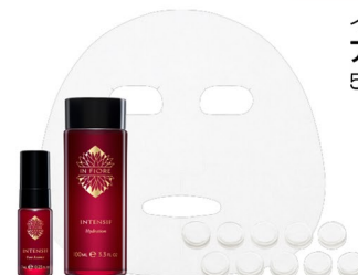
インフィオレ アンタンシフ システム 5,500円(税込)