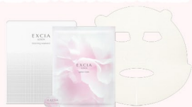
EXCIA ブルーミング ウィークエンド 4回分 11,000円(税込)

【セット内容】 ・ソフニングゴマージュ (マッサージ) 5.0g×4個 ・ジュレマスク (パック) 40ml×4枚