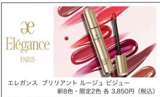
エレガンス ブリリアントルージュ ビジュール 新8色・限定2色 各 3,850円 (税込)

そうするとティント効果がより高くなって、ふいにマスクを外した瞬間でもキレイな自分で見られます♡ぜひ1度お試しくださいませ♡