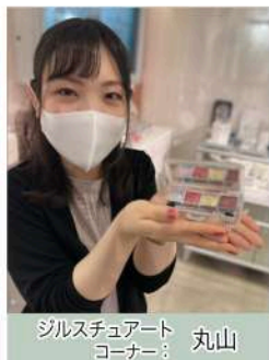
ジルスチュアート コーナー：丸山

JILL STUARTが今秋お届けするのは、色づく街並みとともに、自分の心のまでも染め上げる“赤、をメインにしたアイテムたち。今回はその中から、気軽に赤を取り入れられるアイシャドウをご紹介します。こちらのアイシャドウは、本物の真珠粉末が配合されていることで、まぶたにひと塗りしていただくだけでピュアな透明感と贅沢なキラめきを叶えてくれます。優しい色づきで、メインとなるレッドカラーも馴染みやすく、温かみのある印象に仕上がります。