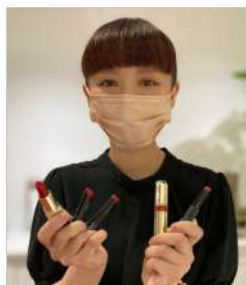
Make up Studio : SAYORI