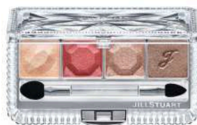
ジルスチュアート エターナルクチチュール アイズ シマー