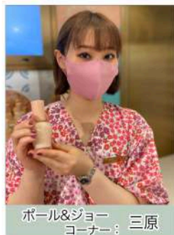
ポール&ジョー コーナー：三原

リニューアルして更にパワーアップ！オレンジフラワー水をベースに4種のヒアルロン酸と、サンゴ草エキス配合の約90%が美容液成分のプライマー。スクレドール効果で内側から放つ光のツヤと透明感。うるおい美しい仕上がりが一日中つづきます。